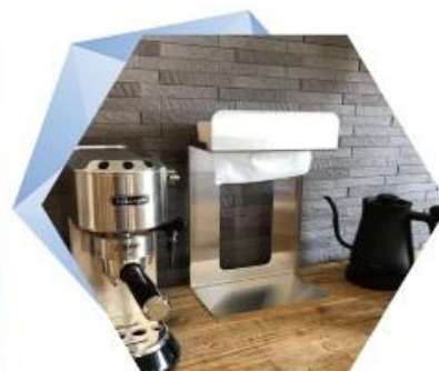
ペーパーホルダー 【ドライアシストPRO】 自立型・棚掛型