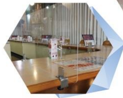
飛沫感染防止用アクリルパーテーション 【飛沫防止アシストPRO】 固定型・置き型 スタンド型