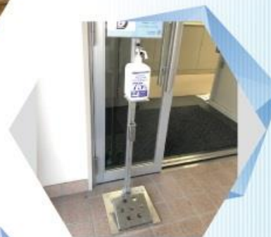
足踏み式除菌スタンド 【除菌アシストPRO】